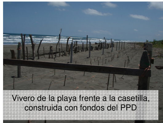
Vivero de la playa frente a la casetilla, construida con fondos del PPD