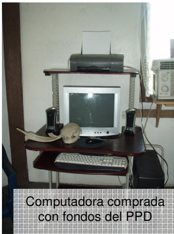
Computadora comprada con fondos del PPD