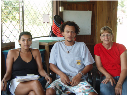
Miembros de ASTOP que participaron en la reunión de evaluación