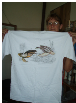
Camiseta elaborada con fondos del PPD