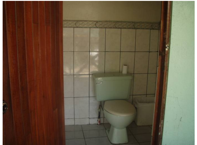
Baños sanitarios arreglados con la Iniciativa del PPD, como parte de la Infraestructura para un mejor servicio de Guiado en la iniciativa del PPD