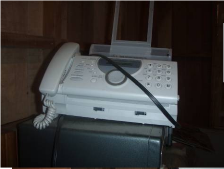
Fax en la bodega del equipo, sin utilizar