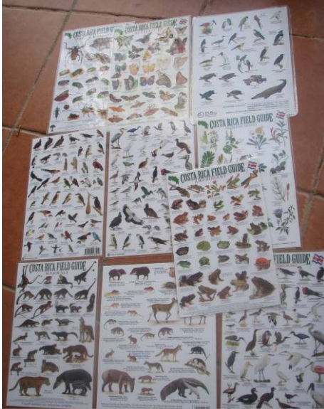
Guías de aves comparadas con la iniciativa del PPD