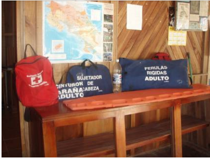
Equipo comprado con fondos de PPD. Cascos y cuerdas, y equipo de emergencia