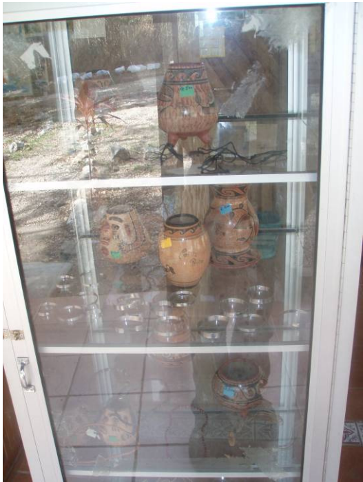
Vitrina de la artesanía en la Infraestructura de atención de visitantes