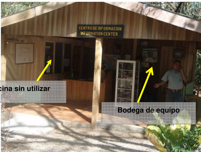
Oficina sin utilizar