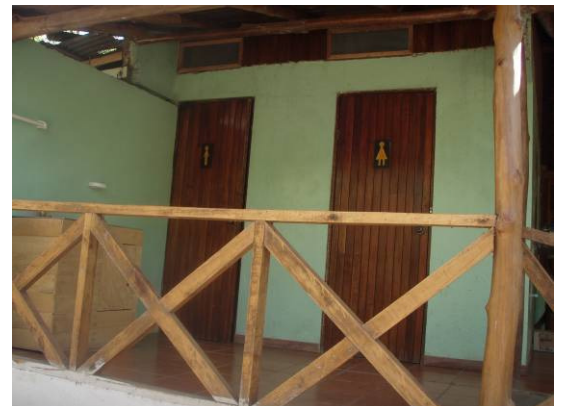
Fachada de los baños