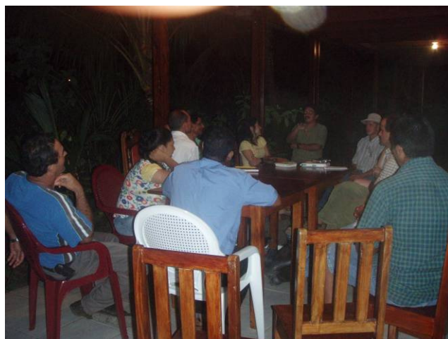
Reunión con los integrantes de la comunidad, en la sesión de evaluación