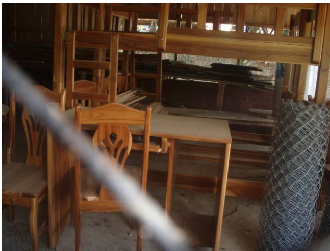
Camarotes almacenados en el centro comunal de la comunidad, estos fueron financiados con recursos del PPD