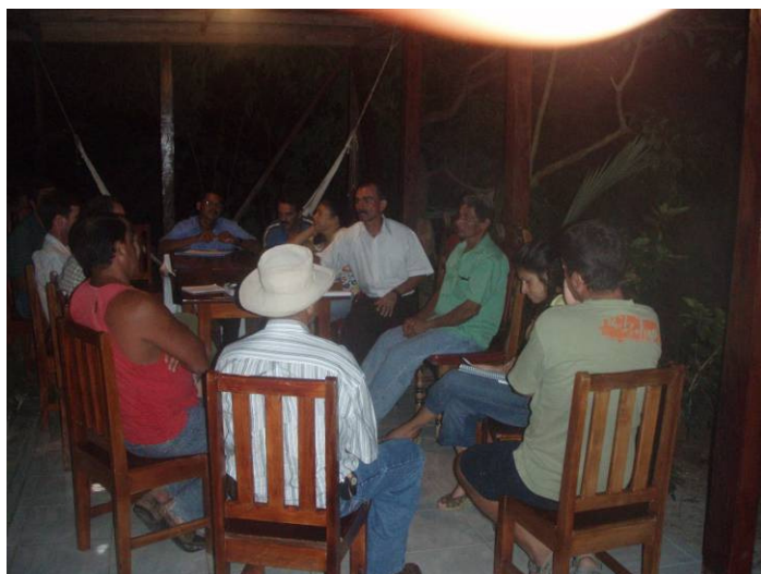
Reunión con los integrantes de la comunidad, en la sesión de evaluación