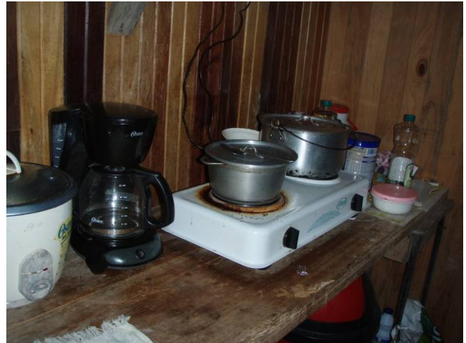
Fotos de la oficina que ahora es casa de habitación.