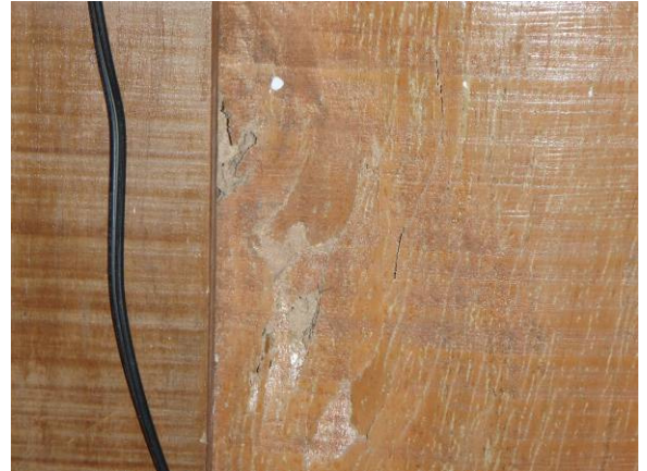
Techo de la oficina, deteriorado, con huecos y faltantes de reglas