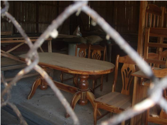
Mesa de reunión almacenada en el centro comunal de la comunidad, financiada con recursos del PPD