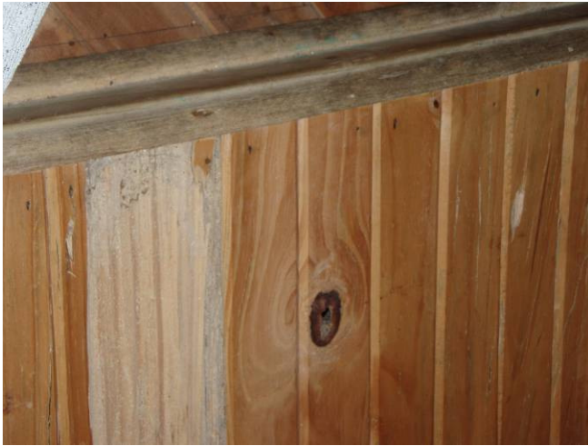
Paredes de Madera infectadas de comején en la oficina construida con fondos de PPD, se denota los huecos realizados.